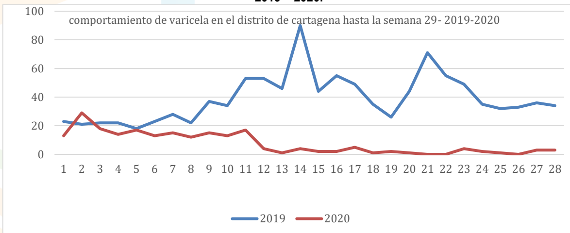
Figura 4. Comportamiento de la notificación de varicela hasta semana 29, en el distrito de Cartagena 2019 – 2020.