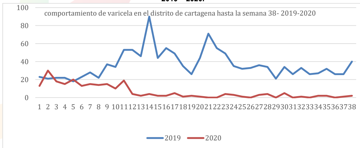
Figura 4. Comportamiento de la notificación de varicela hasta semana 38, en el distrito de Cartagena 2019 – 2020.