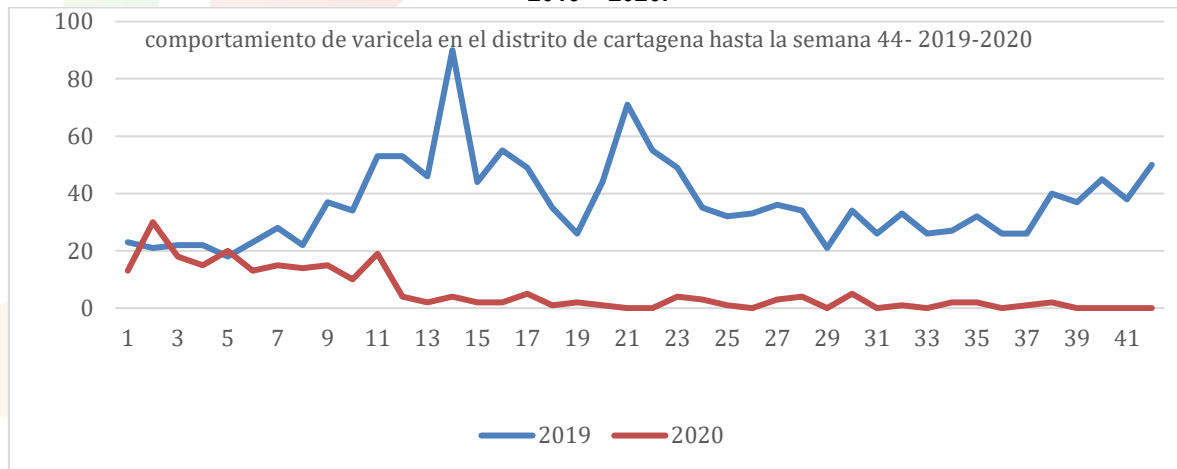
Figura 4. Comportamiento de la notificación de varicela hasta semana 45, en el distrito de Cartagena 2019 – 2020.